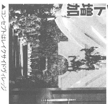
▲コンセプトはライオンがライオン

「シヤベルは湖のほとり、四季を感じられるガーデンにあり、コンセプトは『ライオンがライオン』に決定しました。村に昔から佇み、結婚式がある人々が飾りつけるようなシヤベルというイメージです。」(永野氏)