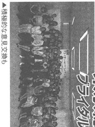
▲積極的な意見交換も